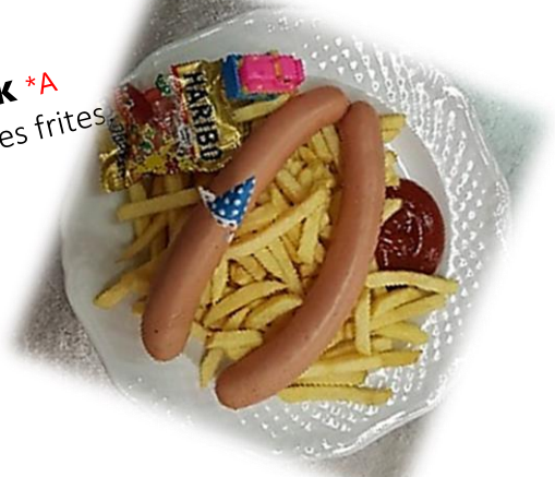
Donald Duck *A Würstel, Pommes frites, Ketchup € 8,30