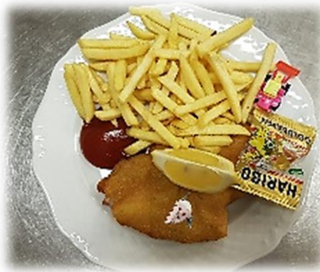
Biene Maja *ACGL Wienerschnitzel, Pommes frites, Ketchup € 8,30