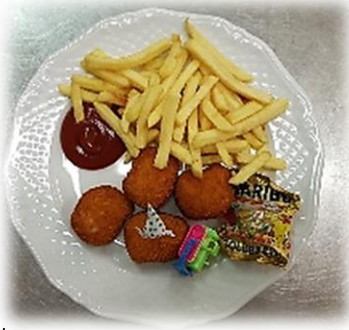
Bambi *AC Gebackene Hühnernuggets, Pommes frites, Ketchup € 8,30