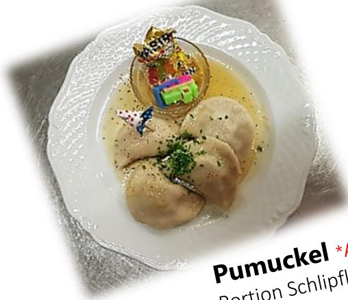
Pumuckel *AGL Portion Schlipfkrapfen € 7,00