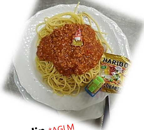
Aladin *AGLM Spaghetti Bolognese € 8,00

Ketchup ,Mayonnaise *CM, Senf*M Zu allen Kindermenüs gibt es eine kleine Überraschung!